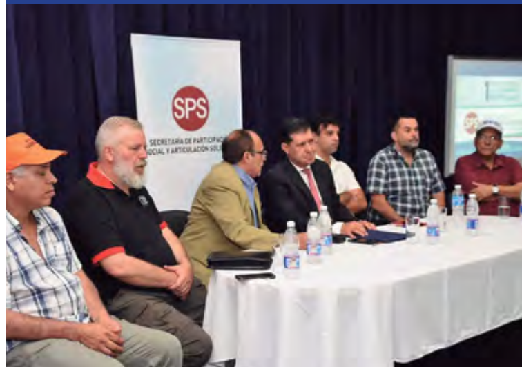
Foro Regional de la Economía Popular, La Rioja, con la presencia de los dirigentes de la CCC, Barrios de Pie, el Sindicato de Ladrilleros y la CTEP.